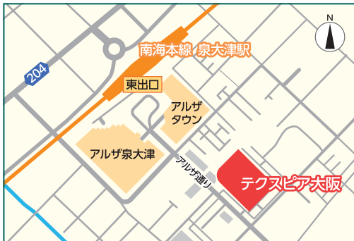
南海本線 泉大津駅から徒歩3分